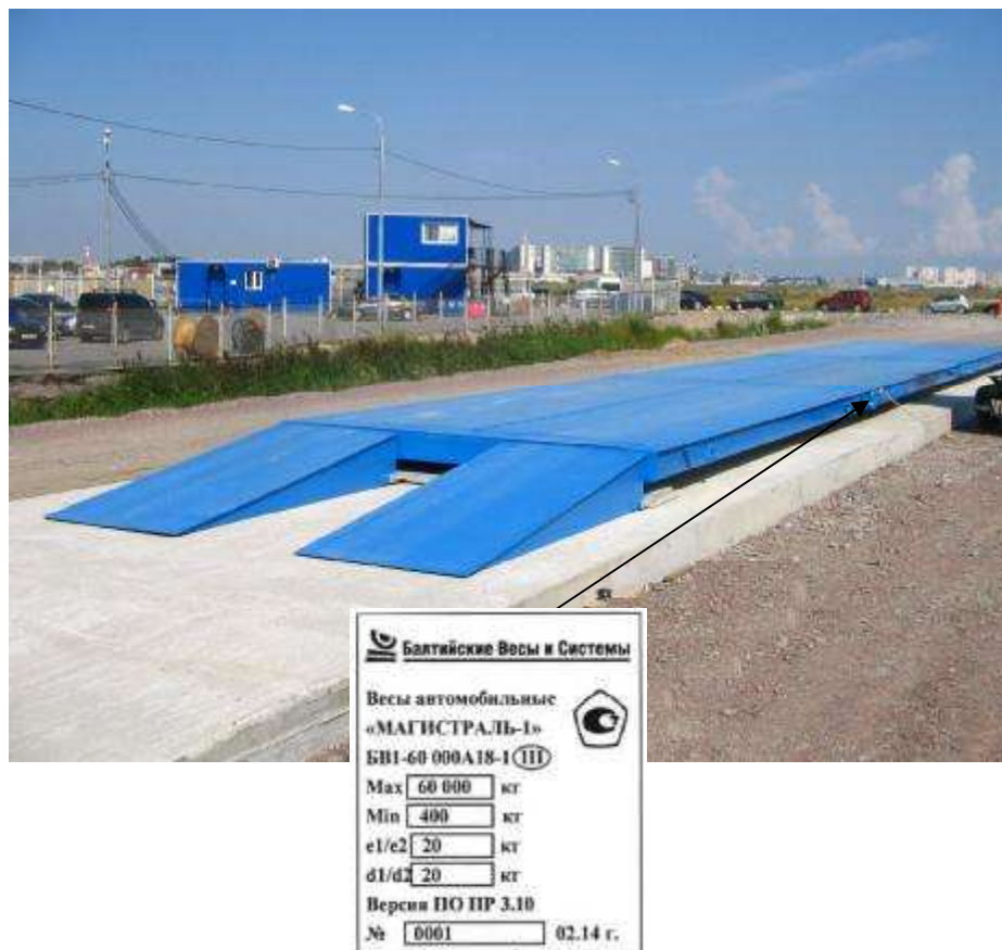
Рисунок 3 - Маркировка весов на грузоприемном устройстве

В весах предусмотрена защита компонентов и предварительно установленных регулировок (регулировки чувствительности (юстировки)) следующими средствами: