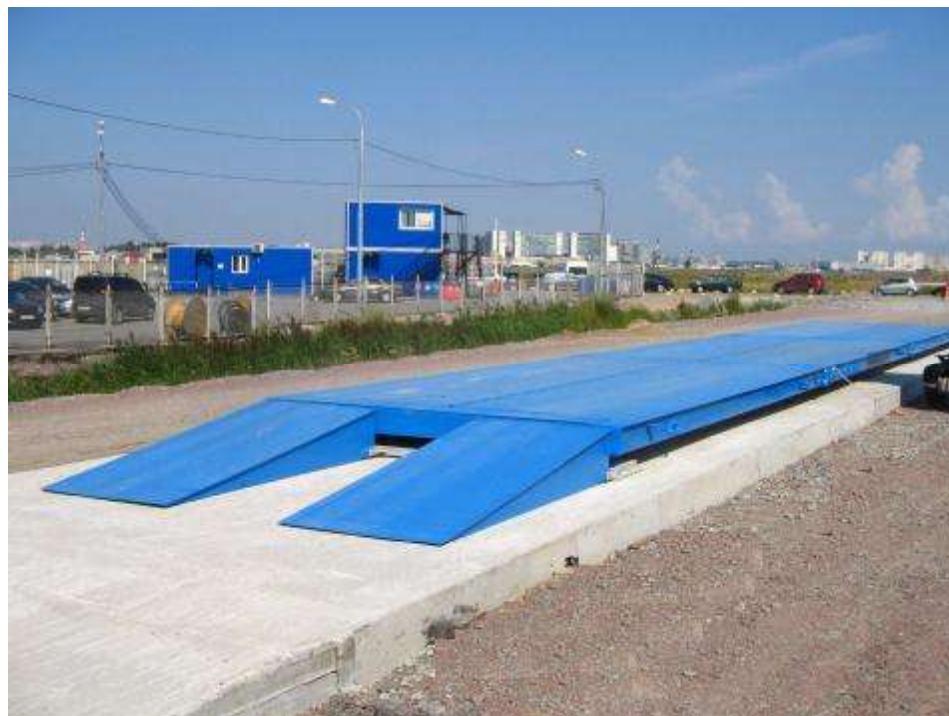
Рисунок 1 - Общий вид весов

Маркировка весов производится на разрушаемой при удалении фирменной наклейке, на которой нанесено: