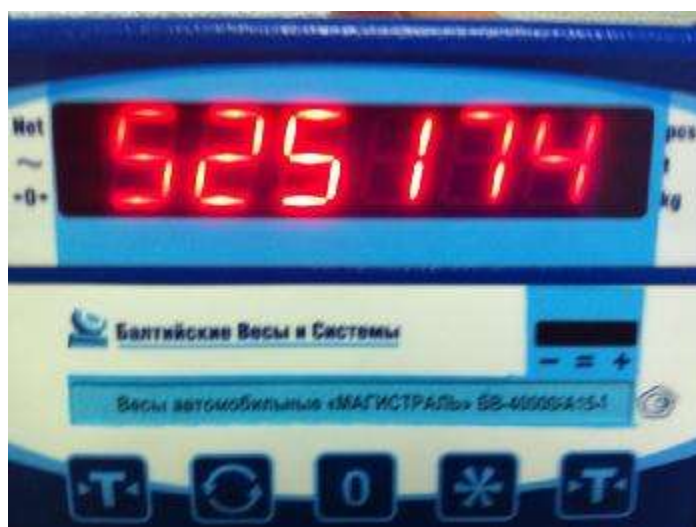
Рисунок 4 – Индикация кода юстировки

После включения весов, по окончании теста раздастся звуковой сигнал и появится сообщение «HELLO», через 3 с, после звукового сигнала на индикаторе появится шестизначный код, идентификационный номер юстировки, а затем установятся нулевые показания.